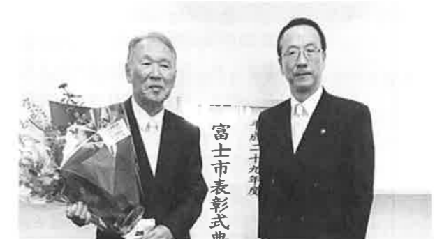
平成 29 年度富士市長表彰 産業功労

多年にわたり、土地家屋調査士として建設業界で活躍され、1991年から20年間、静岡県土地家屋調査士会で理事や副会長、監事等を歴任し、若手の育成に尽力されました。