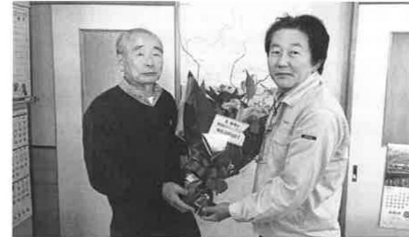
平成 29 年秋の褒章 黄綬 業務精励(土地家屋調査士業)

昨年富士建築士会会員のお二人が秋の褒章、富士市長表彰を受けられました。誠にありがとうございます。