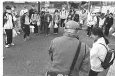
入山瀬駅前にて挨拶