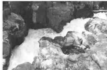
潤井川のポットホール